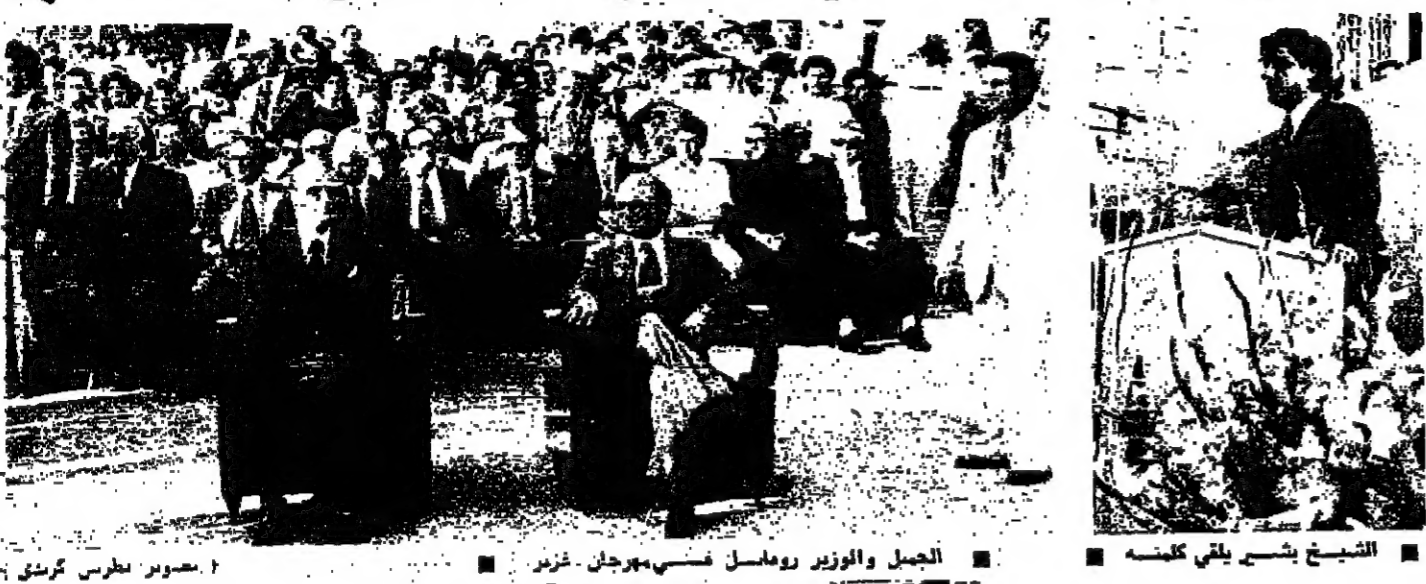
الجميل والوزير روميل فسي مهرجان فزير